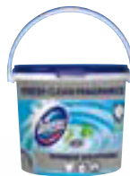
● Domestos Urinal Blocks