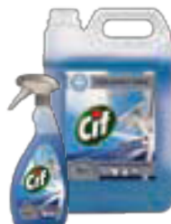
Cif Window & Multi Surface