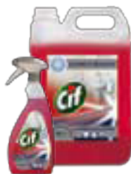
Cif Washroom 2in1

Nasze rozwiązania pozwolą na utrzymanie wysokiego poziomu czystości i higieny powierzchni spotykanych w szpitalach i innych placówkach służby zdrowia. Proponowane produkty pomogą Państwu zapewnić bezpieczeństwo pacjentom, personelowi oraz gościom szpitala / placówki.