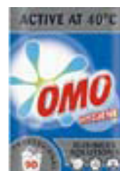
Omo Hygiene 90Wash