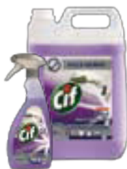
Cif 2in1 Cleaner Disinfectant

Do utrzymania higienicznej czystości w pomieszczeniach kuchennych, wystarczą trzy preparaty chemiczne. Pozostałe produkty przeznaczone są do zadań specjalistycznych tak, aby czyścić szybko i efektywnie. Preparaty te powinny stanowić podstawowy pakiet chemii w każdej restauracji.