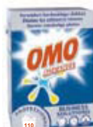
Omo Advance 110Wash