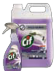
Cif 2in1 Cleaner Disinfectant